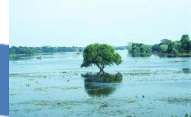
Einnahmen aus dem Wasserentnahmeentgelt 2008